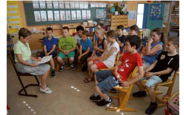
Die ausgebildete seniorTrainerin ist als Lesepatin an der Grundschule in Fachbach tätig

Mit Unterstützung des Seniorenbüros „Die Brücke“ und der Pflegestützpunkte im Rhein-Lahn-Kreis leisten die ehrenamtlich engagierten „NeNas“ (Nette Nachbarn) organisierte Nachbarschaftshilfe. Sie bieten sich beispielsweise als Gesprächspartner, Einkaufshilfe, Begleitung zu Arztbesuchen oder als helfende Hand bei kleineren Reparaturen an.