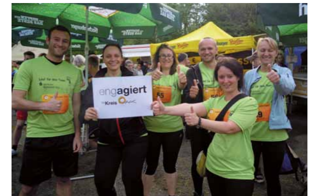
Teamlauf der VG Altenkirchen