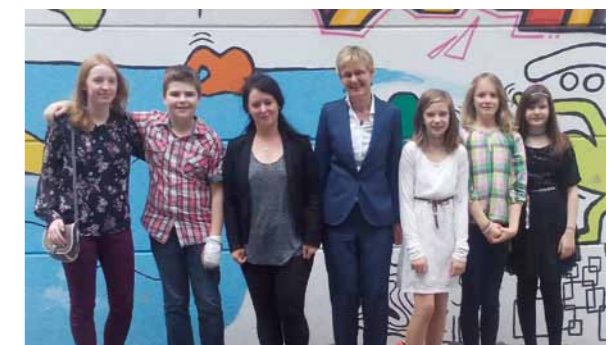
Kooperation mit der Unesco AG des Freiherr-vom-Stein Gymnasiums Betzdorf-Kirchen