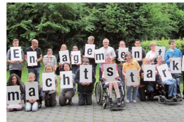
Aktion „Engagement macht Stark“ des BBE mit Mitgliedern der ehrenamtlichen Flüchtlingshilfe im Kreis AK