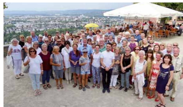
„LernpatenTag“ mit ehrenamtlichen Lernpatinnen/ Lernpaten und OB David Langner