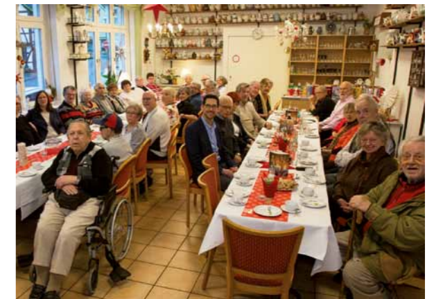
„Heilig-Abend-Treff“ 2019 in Nassau in der AWO Seniorenbegegnungsstätte „Kaffeekanne“

Das Herzensprojekt der Leiterin des Seniorenbüros ist die Ausrichtung der jährlich stattfindenden „Heilig-Abend-Treffs“ . Sie gemeinsam statt einsam mit Gleichgesinnten bei Kaffee und Kuchen, Geschichten, Musik, einem Gottesdienstbesuch sowie Abendessen auf das Weihnachtsfest einzustimmen.