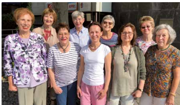
Team der EhrenamtsAgentur/ Geschäftsstelle