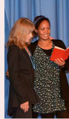
Interkulturelles Frauen-theaterprojekt „Sehnsucht, wonach?“

2013 wurden die Projektpartner beim Landeswettbewerb „Eine Welt – Meine Welt“ prämiert.