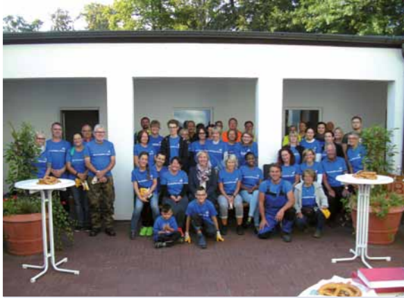
Freiwilligentag Metropolregion Rhein-Neckar