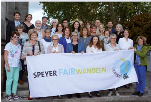
Fairtrade Stadt Speyer

Das Projekt „ Speyer fairwandeln - Fairtrade Stadt Speyer “ wurde durch die Speyerer Freiwilligenagentur mit aufgebaut. An dem Prozess sind inzwischen zahlreiche Organisationen, Verbände, Vereine und interessierte Bürgerinnen und Bürger beteiligt. Die Freiwilligenagentur fungiert als städtische Koordinationsstelle und übt die Geschäftsführung der lokalen Steuerungsgruppe aus. Dies geschieht aus der Überlegung und dem Wunsch der Mitglieder, dass diese Stelle als kommunale Anlaufstelle für bürgerschaftliches Engagement trägerübergreifend mit den verschiedenen zivilgesellschaftlichen Gruppen und Initiativen zusammenarbeitet, die den Prozess des Fairen Handels aktiv vorantreiben und mit Leben füllen wollen. Jedes Jahr gibt es ein gemeinsames Veranstaltungsprogramm im Rahmen der „Fairen Woche“ und verschiedene Veröffentlichungen, z. B. „Faireint kochen - das andere Kochbuch“, „Öko-fairer Einkaufsführer“, Digitaler Jahreskalender sowie eine eigene Homepage: